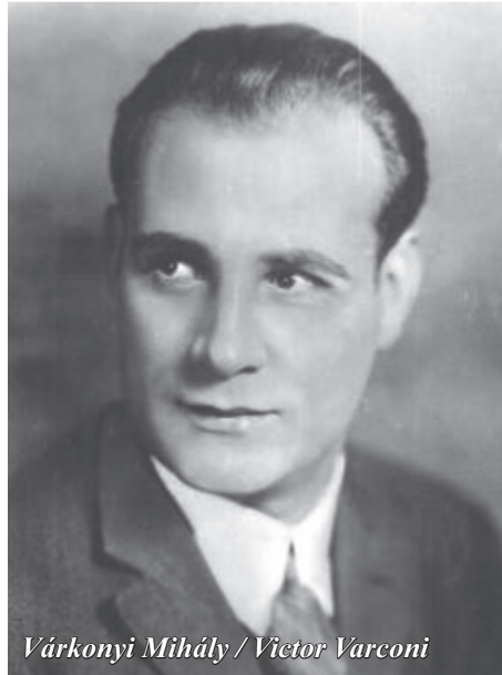
Várkonyi Mihály / Victor Varconi

házaiban vállalt szerepeket, televíziós produkciókban is dolgozott, és nagyon élvezte, ha fiatal színészeket taníthatott. Magyarországra ugyan nem tért vissza, de a Not Enough To Be Hungarian című életrajzában bevallja, hogy sohasem felejtette el