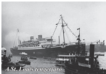
A St. Louis tengerjáró

A vízumot adó országok száma is csökkenni kezdett. 1939 májusában a britek arab nyomásra megtiltották a Palesztinába való letelepedést. Két hajó, a Struma és a Patria több száz menekülttel a fedélzetén elsüllyedt, miután a brit hatóságok nem engedték őket kikötöni.