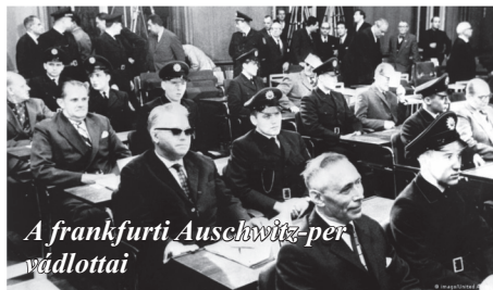
A frankfurti Auschwitz-per vádlottai