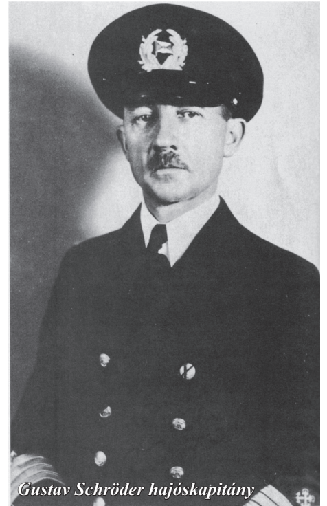
Gustav Schröder hajóskapitány

A St. Louis elhajózott Florida partjainál, majd visszafordult Európa felé. Kanada szigorú törvényei miatt úgy döntöttek, ott meg sem próbálkoznak. Végül a zsidó menekültügyi szervezetek elérték, hogy négy európai ország: Anglia, Franciaország, Hollandia és Belgium ossza el egymás között a menekülteket. Ez akkor hatalmas sikernek tűnt a szervezetek szemében, hiszen nem tudhatták, hogy két hónappal később kitör a háború és alig egy éven belül a kontinentális Európa német kézre kerül.