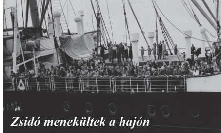
Zsidó menekültek a hajón

zetén alakult rögtönzött bizottság és a kapitány úgy döntött, hogy megkísérlik Amerika partjai felé venni az irányt. A 937 utasból több mint 700-an szerepeltek az amerikai vízumlistán. Ez volt a hajó utolsó próbálkozása. A zsidó menekültügyi szervezetek és a hajón rekedtek rokonai is levelekkel bombázták a Fehér Házat .