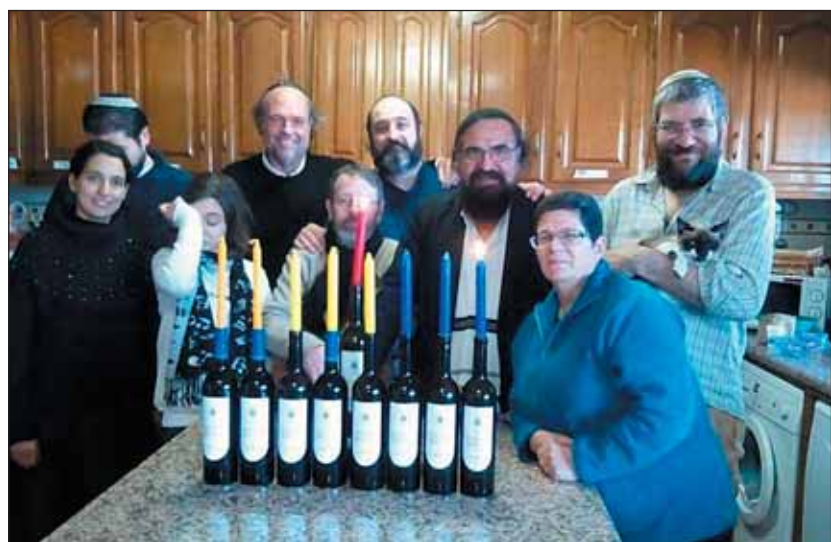
Chanukkahoz addig kell inni, hogy Antiochus Epiphanészt összetéveszd Jüda Makkabival? (Chanukkai gyertyagyújtás Portugáliában)

Az utolsó terem a Tantárgy és barokchba nevet kapta. Ezt az egyedülálló „tantermet” középiskolás diákok készítették a kiállítás részeként. Hat középiskola diákja működött itt együtt, akik közösen megtervezték a koncepciót, majd együtt elrendezték a tárgyakat, elkészítették a dekorációt, és kitalálták a múzeumpedagógiai programot is.